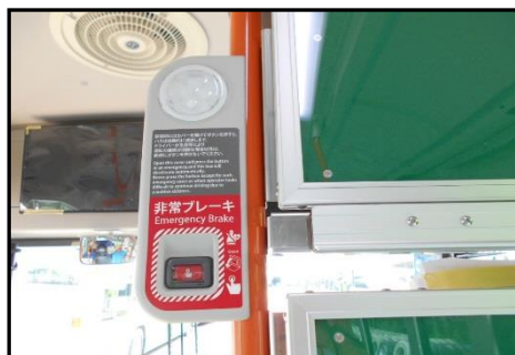
非常ボタン(客席部前方 1ヶ所)